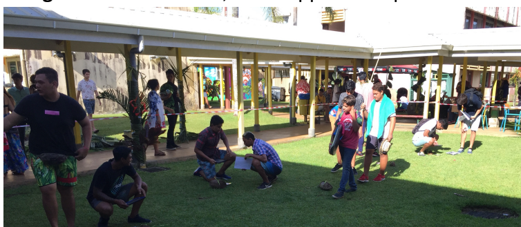
Visiteurs utilisant les iPads pour explorer la reconstitution du lagon de Teahupo'o

Pour explorer ces différentes zones du lagon, les visiteurs sont munis d'iPad afin d'utiliser la réalité augmentée via l'application « Mirage Make ». En effet, cette application permet de générer des QR codes qui, une fois scannés par l'iPad, donnent une description de la zone du lagon qu'ils représentent. A partir de la description générée par le QR code, les visiteurs doivent déterminer si la zone explorée correspond à une zone qu'on leur a demandé de mettre en rahui ou pas. Si c'est le cas, ils doivent entourer cette zone sur la carte qui leur a été fournie.