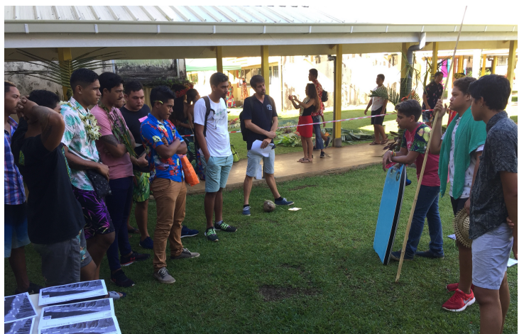
A gauche les visiteurs de l'atelier, à droite des élèves jouant le rôle de différents acteurs de la commune de Teahupo'o

C'est à partir de cette fiche de synthèse que les élèves qui, lors de la journée polynésienne, jouent le rôle des acteurs de la population de Teahupo'o, construisent le discours qu'ils tiendront aux visiteurs de l'atelier. En effet, après l'exposé sur le rahui, 3 élèves doivent accueillir les visiteurs dans la reconstitution du lagon de Teahupo'o. Chacun de ces trois élèves représente un acteur de la commune de Teahupo'o et chacun des trois élèves doit décrire une zone à placer en rahui et expliquer pourquoi.