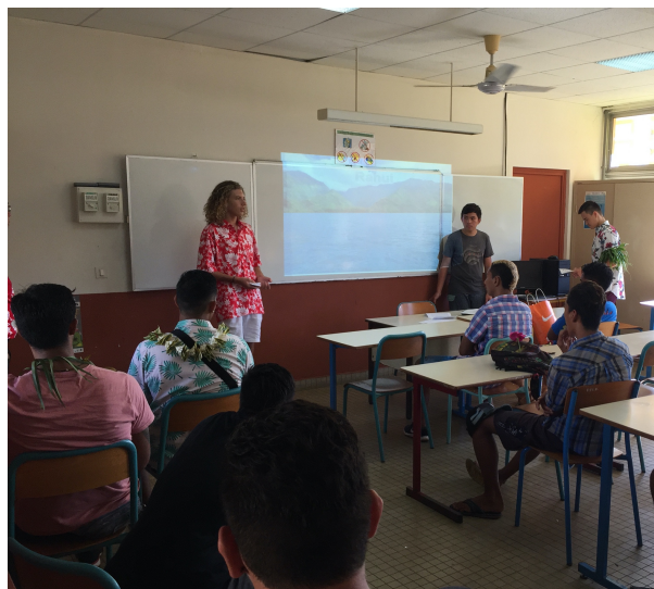
Un groupe de 3 élèves faisant l'exposé du rahui devant une classe de visiteurs