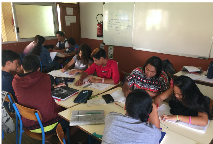
Élèves travaillant en groupe sur les différents futurs imposés

Les différentes actions à sélectionner/laisser de côté/décrire sont celles qui ont déjà été identifiées dans le portrait de territoire : ce sont les relations sociétés/milieus qui sont à présent bien connues des élèves (la société a protégé le lagon, la société a dégradé le lagon, la société a valorisé le lagon). Ce travail s'est fait en groupe.