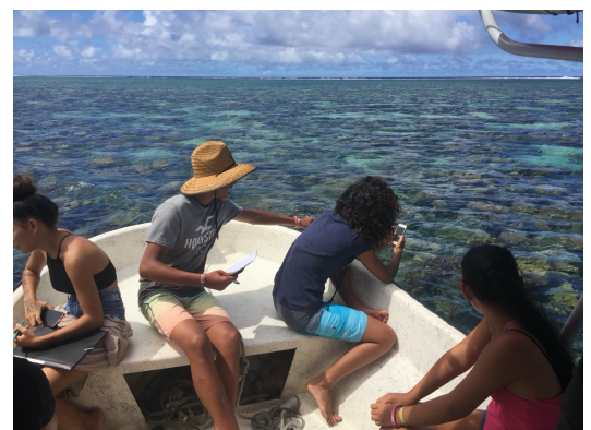
Observation et prise de renseignements pour le questionnaire