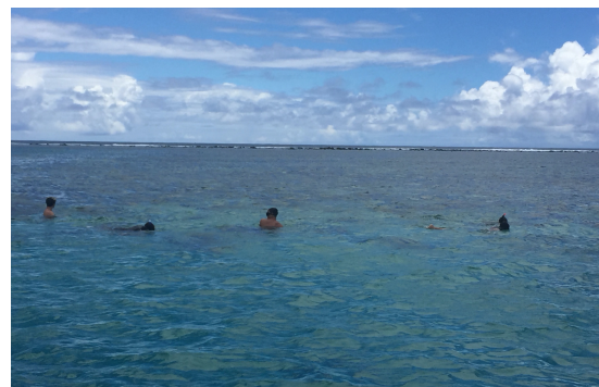
Élèves réalisant un comptage dans la zone du rahui

L'étape de diagnostic du terrain doit permettre de passer à la 2 e phase de la démarche prospective : réaliser un portrait de territoire