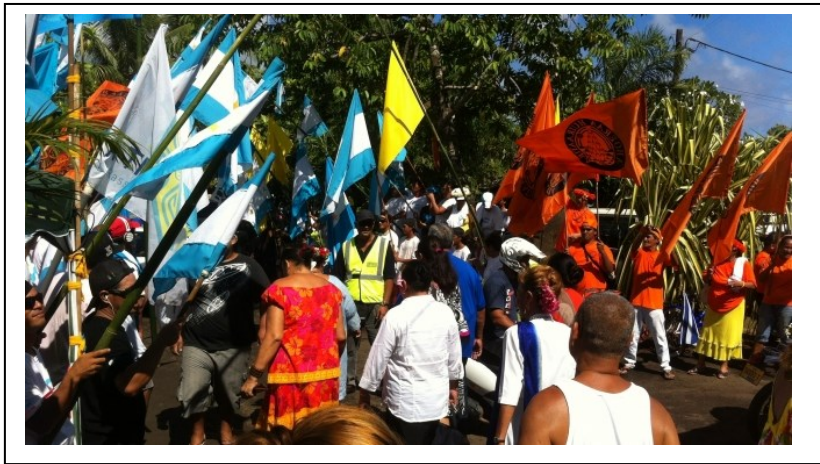
Doc. 3 : Photographie prise durant les élections en 2013